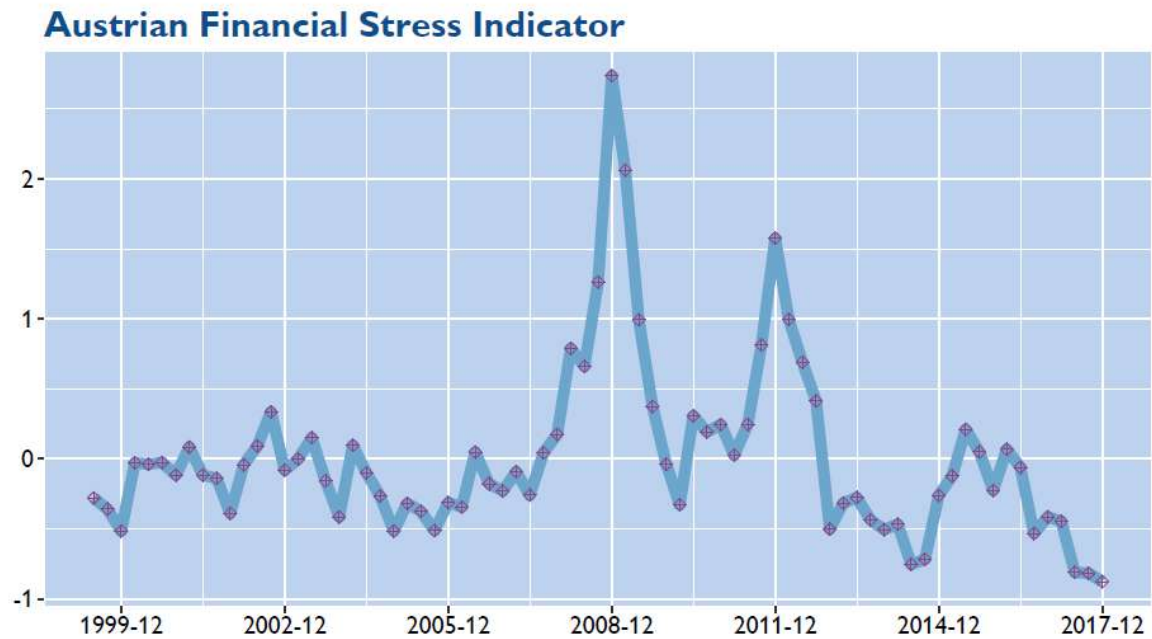
Grafik 2: Verlauf Austrian Financial Stress Indicator